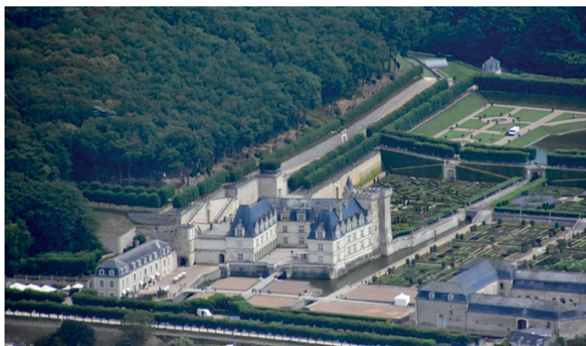
Château de Villandry