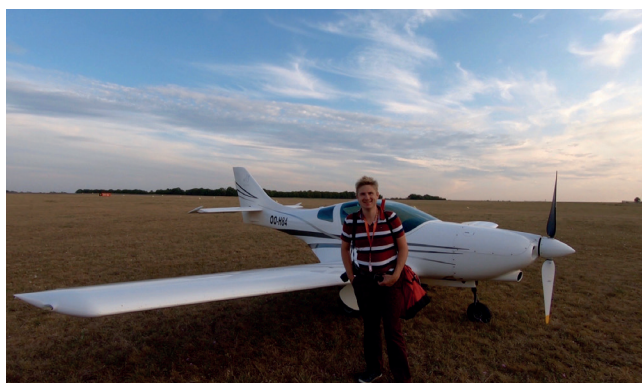
Airport Bourges (LFLD)

De luchthaven van Bourges ligt dicht tegen het centrum van Bourges (+-2km). We namen een hotel in het centrum en wandelden tot het hotel. Bij check-in kregen we meteen als tip dat het 'Les Nuits Lumière de Bourges' was (meer info via www.ville-bourges.fr en http://storymap.ville-bourges.fr/nuits_lumiere/ ). Heel de zomer, van eind juni tot 21 september, kan je in het historisch centrum van Bourges een wandelroute door