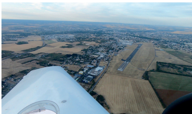
Airport Bourges (LFLD)