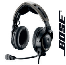
Bose Headset A20

Bezoek onze website. Contacteer ons voor een vrijblijvende offerte.