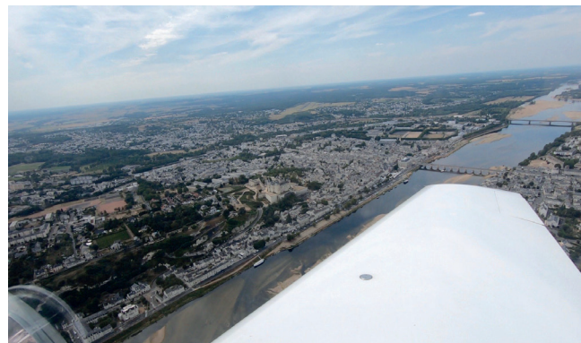
Aerodrome Saumur (LFOD)

Er was niemand aanwezig op de Aéroclub de Saumur. Na ons landde er nog een vliegtuig. We vroegen aan deze piloot of we het vliegtuig deze nacht in de hangaar konden zetten, maar dit moet op voorhand aangevraagd worden. Je mag wel altijd op het gras parkeren maar dit betrouwen we niet. We hadden na het ontbijt nog niet gegeten dus besloten we om naar het centrum te wandelen om daar iets te eten. We gingen te voet naar het centrum van Saumur, ongeveer 30 minuten (bergaf) wandelen. We belden naar de luchthaven van Bourges om te zien of daar een hangaarplaats beschikbaar was. Dit was niet het geval maar de VL3 kon buiten blijven staan. Bourges Airport is een beveiligde, volledig omheinde, luchthaven met camerabewaking. Er werd ons wel gezegd dat er niemand meer aanwezig is na 17u maar je kan er altijd landen (24u op 24u).