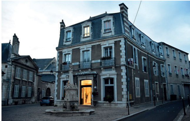
Hôtel d'Angleterre (Best Western Plus)

Beoordeling: We waren zeer tevreden over dit hotel. Het was goed gelegen midden in het centrum, in een prachtig, historisch gebouw. Het personeel was zeer vriendelijk en behulpzaam. Het ontbijt was in buffetvorm, uitgebreid en zeer verzorgd.