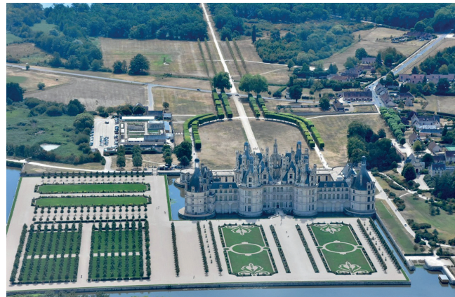
Château de Chambord

We vertrokken om 12u09 vanuit Bourges. We vlogen op 1750ft naar het kasteel van Chambord. Hier vlogen we 2 toertjes rond het prachtige kasteel met zijn honderden torentjes en schoorstenen. We daalden daarbij geleidelijk tot 1000ft. Rond het kasteel is een restricted area dus volledig overvliegen is niet toegestaan.