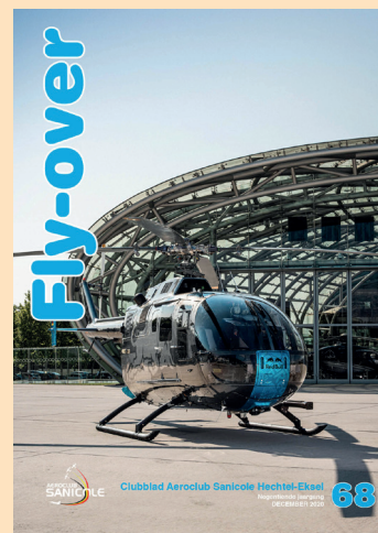
Bij de cover Flying Bulls BO 105 CBS