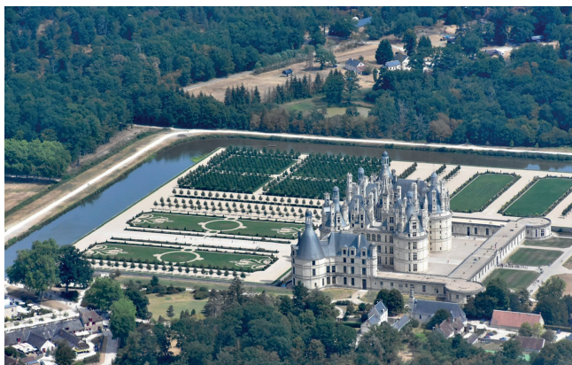
Château de Chambord

's Morgens, na een rijkelijk ontbijtbuffet in het hotel, verkenden we het historisch centrum van Bourges. Bourges vonden we een heel mooie en gezellige stad waardoor we hier zeker nog willen terugkomen. De stad ligt ook het dichtst bij de luchthaven wat zeker een pluspunt is. Op Place Saint Bonnet is er op zondag markt. We kochten er "saucisson secs", 3 voor 10 Euro. Om 11u30 checkten we uit en lieten we een taxi ons naar de luchthaven brengen (het was ondertussen al behoorlijk warm). De rit van 10 minuten kostte 14,30 Euro.