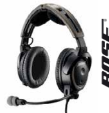
Bose Headset A20

Bezoek onze website. Contacteer ons voor een vrijblijvende offerte.